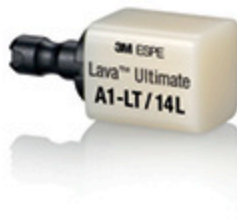
LAVA ULTIMATE Matériau nanotechnologique pour restauration définitive