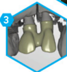
3 Modélisation de l'armature CAO