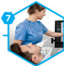
7 Scellement du bridge