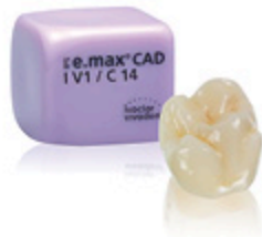
IPS E.MAX Bloc vitrocéramique au disilicate de lithium