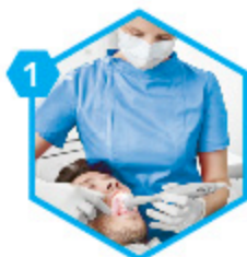
1 Prise d'empreinte numérique

Envoi du fichier STL du dentiste au laboratoire LDA sur le mail : cfao@laboratoirelda.com