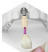
PILIER BIOLINE + COURONNE BIOLINE

Nous avons développé au sein de notre laboratoire la gamme Bioline, toutes ces prothèses sont biocompatibles, inallergiques et esthétiques.