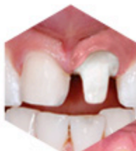
INLAY CORE BIOLINE + COURONNE BIOLINE