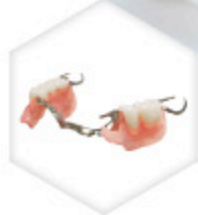
STELLITE FINITION BIOFLEX