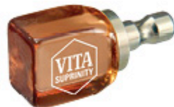
VITA SUPRINITY La nouvelle céramique vitreuse haute performance dopée au dioxyde de zirconium