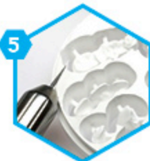
5 Usinage de l'armature titane, zircon ou Chrome Cobalt.