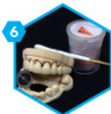
6 Finalisation de la prothèse sur le modèle imprimé par nos artisans

Nous usinons des armatures simples, des barres sur implant, des piliers personnalisés et des chassiss métalliques