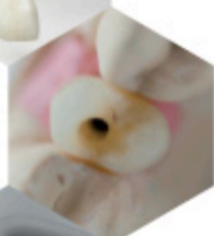
COURONNE BIOLINE TRANSVISSÉE SUR EMBASE TITANE