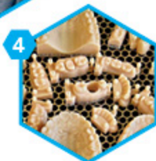
4 Impression 3D du modèle