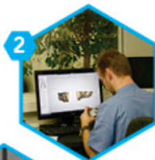
2 Gestion du fichier au laboratoire LDA

Envoi du fichier STL du dentiste au laboratoire LDA sur le mail : cfao@laboratoirelda.com