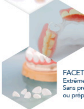
FACETTE BIOLINE Extrême finesse 0,3 mm Sans préparation, ou préparation à minima